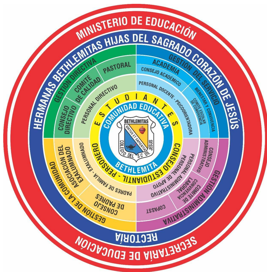
Fig. 3. Organigrama del Colegio Sagrado Corazón de Jesús Hnas. Bethlemitas Bucaramanga