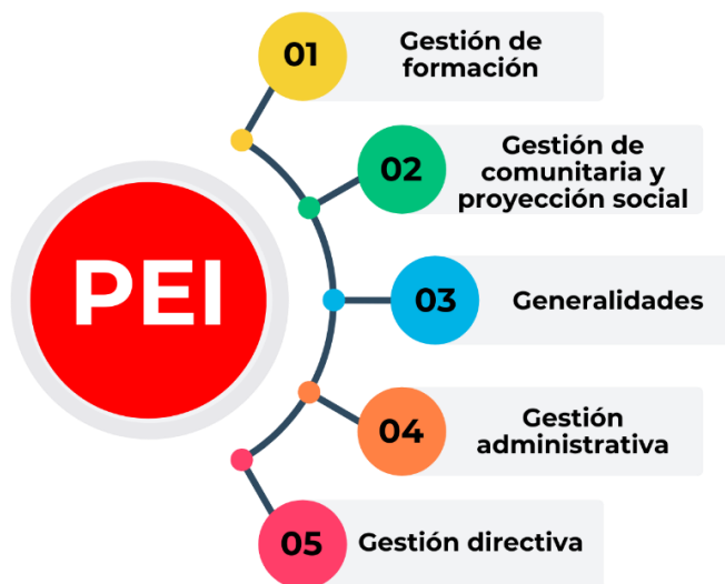
Figura 1. Estructura General del Proyecto Educativo Institucional.

A continuación, se presenta la estructura general del proyecto educativo Institucional.