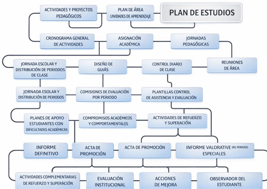
Fig. 6. Secuencia esquemática de la prestación del servicio educativo.

A continuación, se presenta la secuencia de actividades que conforman la prestación del servicio educativo en el colegio.