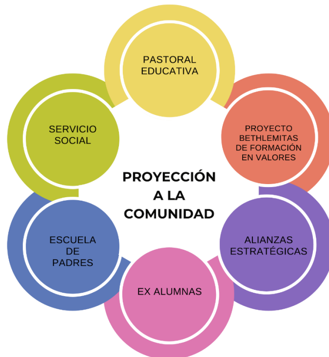
Fig. 7. Esquema general de proceso de proyección a la comunidad.

Este tipo de eventos y proyectos, tienen como principio la extensión de los valores Bethlemitas. A continuación, se ilustran los componentes de la proyección social en la institución