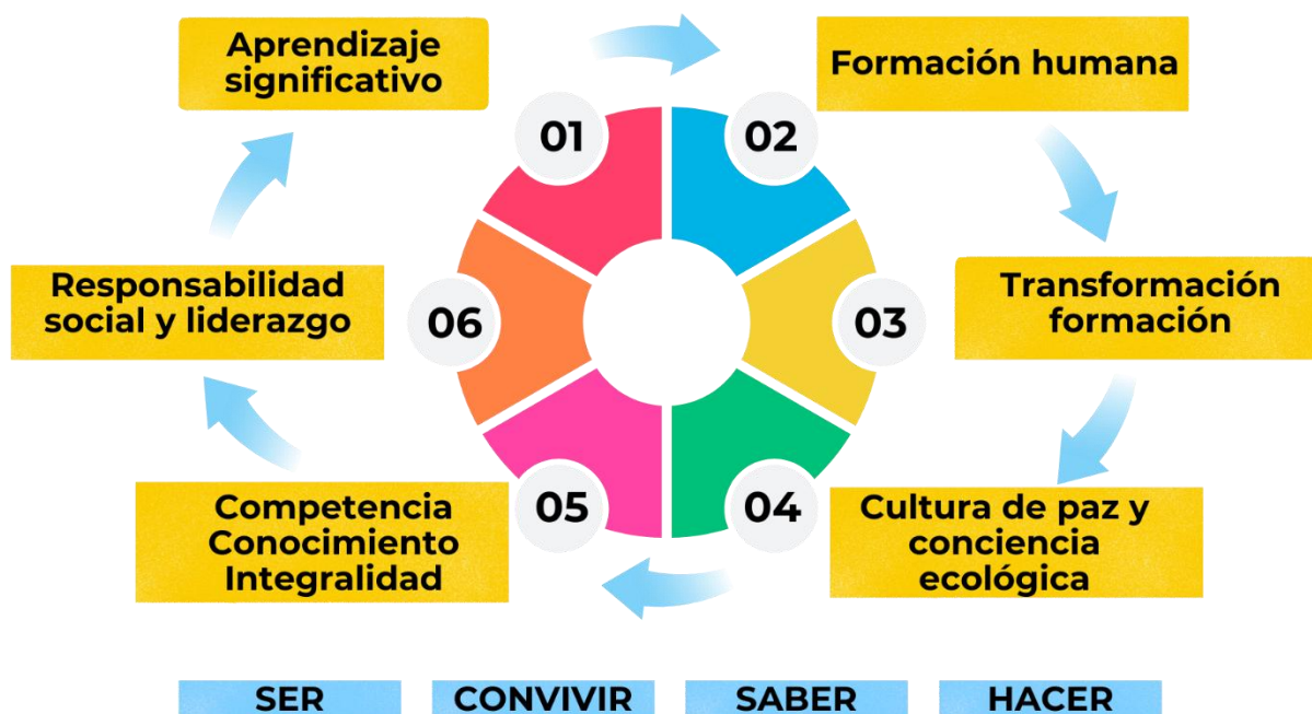
Fig. 4. Modelo holístico y por competencias para la comprensión.

A continuación, se resume la interrelación del modelo Holístico y el componente por competencias que debe ser asumido por los docentes desde el aula de clase